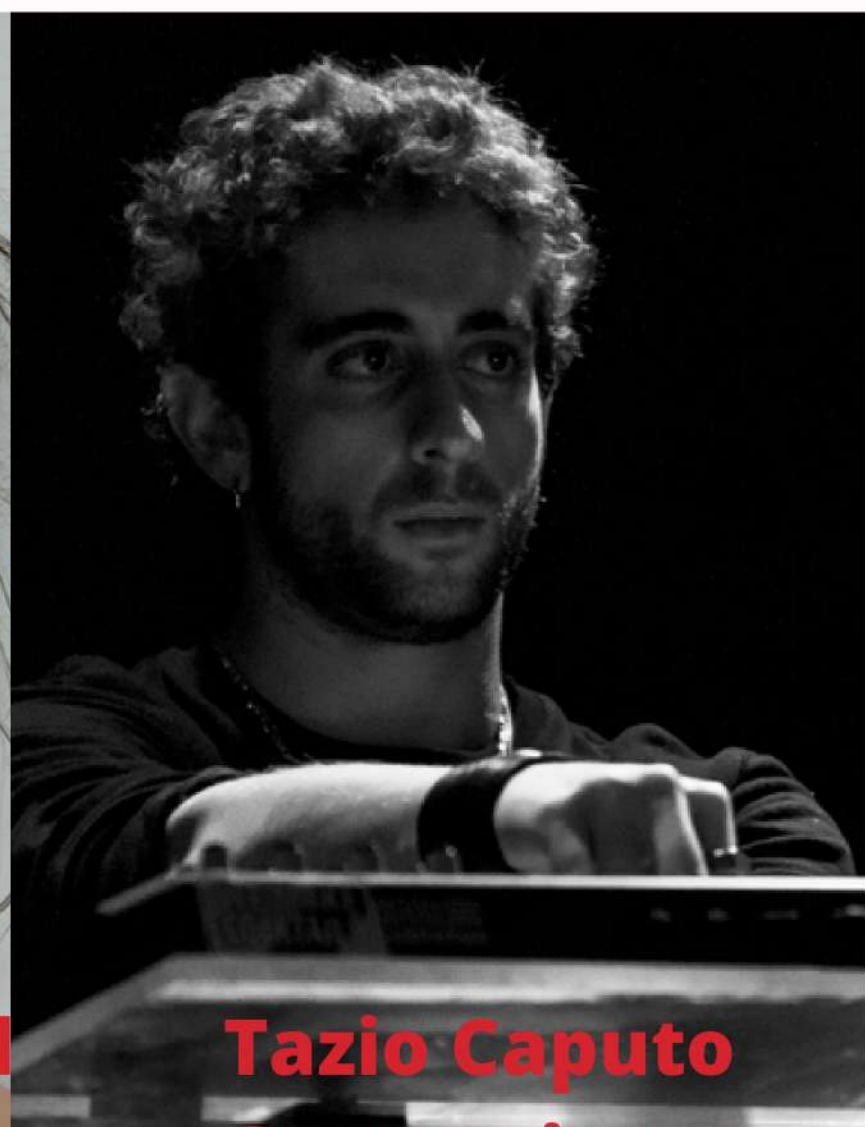
Tazio Caputo Compositeur